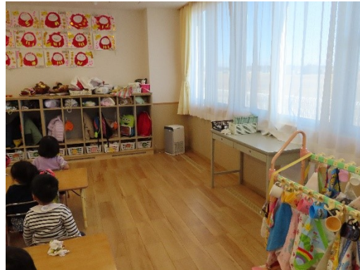
クラスへの空気清浄機設置