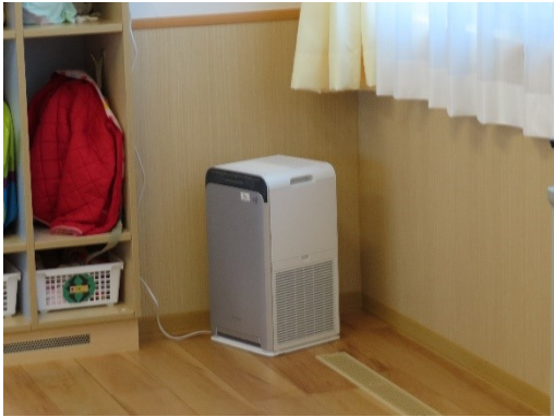
クラスへの空気清浄機設置