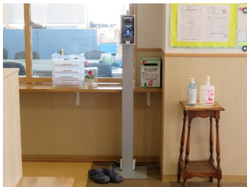
玄関へのサーモカメラ設置

また、空気清浄機を各クラス、遊戯室、事務室など人が集まる場所に設置することで、換気の補助をして、室内の空気を循環させ、24 時間換気システムと併用していくことで、新型コロナウイルス感染症などの集団感染を防ぐ効果を上げることができます。